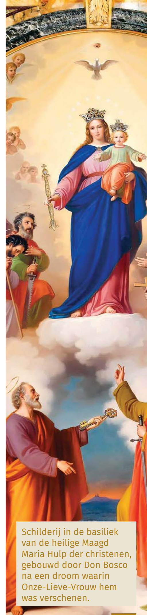
Schilderij in de basiliek van de heilige Maagd Maria Hulp der christenen, gebouwd door Don Bosco na een droom waarin Onze-Lieve-Vrouw hem was verschenen.

Het opvoedingssysteem van Don Bosco wierp opzienbarende vruchten af. Na een retraite in een jeugdgevangenis van Turijn - met